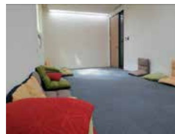
团体谘询实作练习室