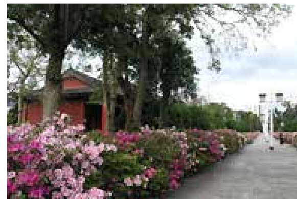
淡江大学宫灯教室