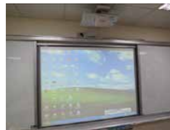
大型触控式教学投影萤幕

联系询问：新浪博客 http://blog.sina.com.cn/u/3088162050