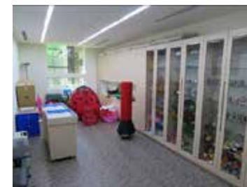
双沙盘游戏治疗室