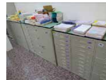
完整丰富的心理测验