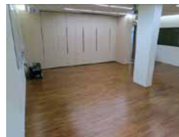
表达性艺术治疗练习室