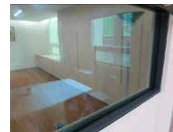
专业单面镜观察室