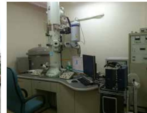
本系耗资 2760 万台币购置的 TEM+EELS