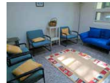
婚姻治疗 / 家族治疗练习室